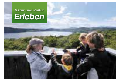
Natur und Kultur Erleben