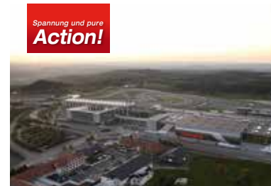
Spannung und pure Action!