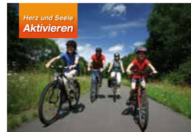
Herz und Seele Aktivieren